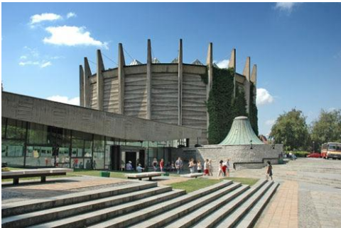
Wrocław – Panorama Raławicka

5.30 - zbiórka . 6.00 - 9.00 - przejazd do Wrocławia 9.00 - 10.30 - zwiedzanie Panoramy Raławickiej. 10.30 - 13.00 - Spacer po Starym Mieście : Ostrów Tumski, Katedra, Ostrów Piasek, Uniwersytet, Rynek Staromiejski, Plac Solny i ulica Świdnicka, „Wrocławskie Krasnoludki”. Czas wolny. 13.00 - 15.30 - przejazd do Karpacza i zakwaterowanie. 16.30 - 19.30 - zwiedzanie miasta: m.in. Świątynia Wang, miejsce zaburzenia grawitacji, skocznia narciarska Orlinek, zapora na Łomnicy. Czas wolny. Obiadokolacja . Nocleg