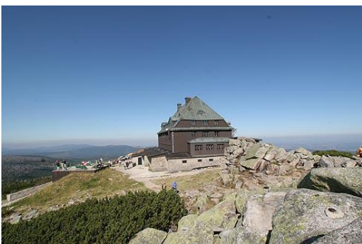
Schronisko na Szrenicy

7.00 - 8.00 śniadanie. Następnie zwiedzanie: Szklarska Poręba - wjazd wyciągiem krzesełkowym i spacer po Szrenicy , Wodospad Szklarki . Wizyta w hucie szkła w Piechowicach . Obserwacja kolejnych etapów procesu produkcji. Możliwość zakupu pamiątek. Obiad . Wyjazd w drogę powrotną. Przyjazd do miejsca zamieszkania w godzinach wieczornych, ok. godz. 21.00 - 22.00