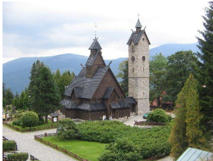
Karpacz – Świątynia Wang