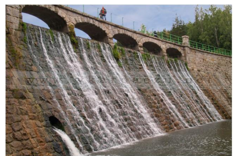
Karpacz – Zapora na Łomnicy