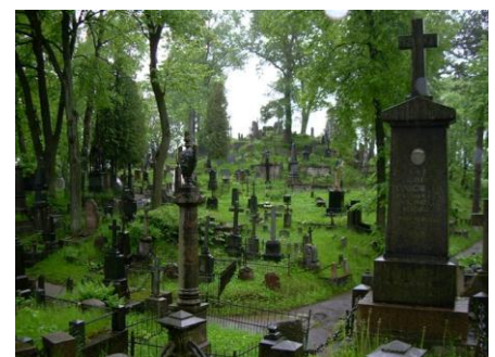
Wilno - cmentarz na Rossie