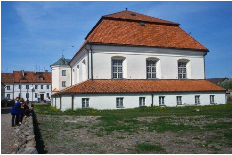
Tykocin - Synagoga

Wyjazd ok. godz. 3.00. Przejazd do Tykcina - rynek, alumnat, synagoga i Choroszczy - letnia rezydencja Branickich. Następnie zwiedzanie Białegostoku : kościół św. Rocha, zabytki ulicy Lipowej, cerkiew Św. Mikołaja, rynek T. Kościuszki (ratusz, kamieniczki, austeria), Cekhaus , kościół Farny, pałacyk gościnny Branickich, pałac Branickich (wejście do sali balowej i kapliczki), park pałacowy. Czas wolny Przyjazd do miejsca zakwaterowania. Obiadokolacja. Nocleg