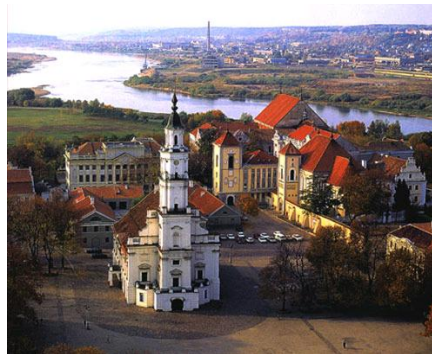
Kowno - Stare Miasto

Program ma charakter informacyjny i może ulec niewielkim zmianom (m.in. kolejność zwiedzania). Cena uzależniona jest od ilości uczestników i terminu wycieczki.