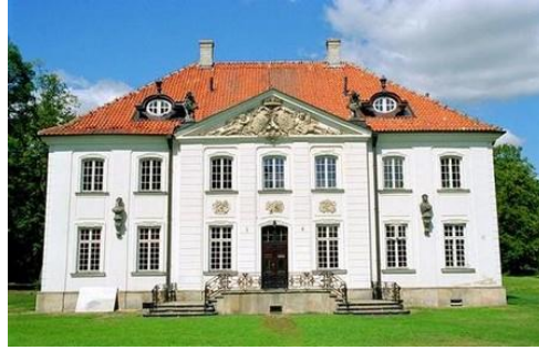
Choroszcz - Rezydencja Branickich