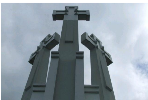
Wilno - wzgórze Trzech Krzyży

Po śniadaniu zwiedzanie Wilna : Wyjazd i spacer na wzgórze Trzech Krzyży (piękna panorama miasta). Poznawanie starówki: Ostra Brama, Kościół Piotra i Pawła, Klasztor Św. Trójcy, Prawosławny Klasztor Św. Ducha, -zautek bernardyński" wraz z domem Adama Mickiewicza, gotycki Kościół Św. Anny, Kościół Katedralny, Dzielnica Żydowska, Dolny Zamek, Cmentarz Bernardynów - najstarszy cmentarz wileński oraz Cmentarz na Rossie - największa nekropolia wileńska, gdzie spoczywa wielu wybitnych Polaków. Czas wolny. Obiadokolacja. Nocleg