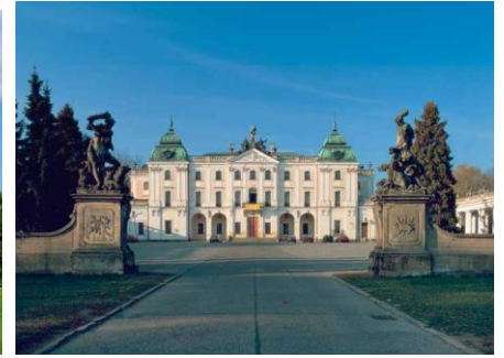
Białystok - Pałac Branickich