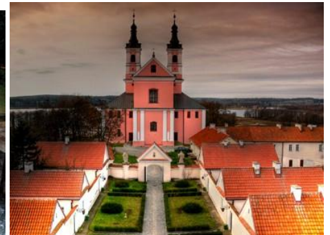
Klasztor na Jeziorze Wigry