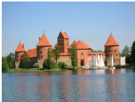
Zamek w Trokach

Po śniadaniu przejazd do Trok siedziby Kiejstuta i Witolda, dawnej stolicy Wielkiego Księstwa Litewskiego. Zwiedzenie z zewnątrz Nowego Zamku, ulicy, karczmy i cmentarza Karaimów, kościoła Farnego z 1409 - fundowanego przez Księcia Witolda. Możliwość przejażdżki jachtami po Jeziorze Galve. Przejazd do Kowna . Spacer po pięknej kowieńskiej starówce. Oglądanie gotyckiego Domu Peruna, kościoła Archikatedralnego, barokowego Ratusza na rynku, otoczonego zabytkowymi kamienicami, kościoła NMP i Mikołaja z XV w., zamku. Wyjazd do Polski. Po drodze obiad na Suwalszczyźnie. Powrót do domu w godzinach nocnych.