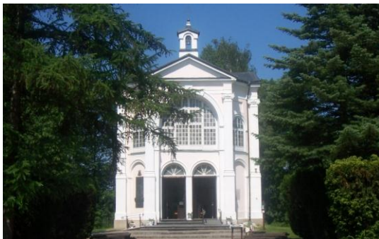
Studzieniczna - Sanktuarium

Śniadanie. Wyjazd do Studzienicznej - Sanktuarium Matki Boskiej, które w 1999 r. odwiedził papież Jan Paweł II. Rejs statkiem po Jeziorze Studzienicznym i Kanale Augustowskim . Klasztor w Wigrach . Przejazd do Wilna. Obiadokolacja. Nocleg.