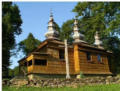
DREWNIANA CERKIEW W RZEPEDZI