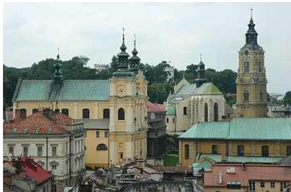
PRZEMYŚL – PANORAMA MIASTA