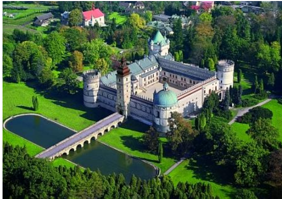
ZAMEK W KRASICZYNIE

Śniadanie. Zwiedzanie: Krasiczyn : Zespół Zamkowo-Parkowy. Przemysł : (Rynek, archikatedra, zamek, kościół Franciszkanów, katedra unicka, Muzeum Archidiecezjalne, Zniesienie i Kopiec Tatarski). Wyjazd w drogę powrotną. Po drodze obiad. Przyjazd do Sieradza w godzinach wieczornych.