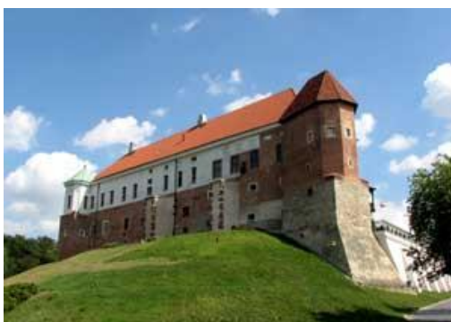
SANDOMIERZ - ZAMEK