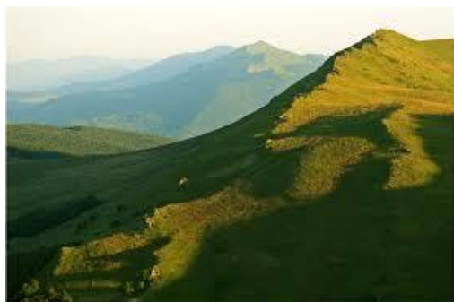
BIESZCZADY - POŁONINA WETLIŃSKA

Po śniadaniu przejazd do Wetliny , po czym spacer na Połoninę Wetlińską do Chatki Puchatka - około 3 godz. Następnie przejazd kolejką wąskotorową z Majdanu do Przystupia wraz z napadem bandytów na pociąg . Po południu wizyta w Cisnej w słynnej knajpie Siekierzada . Wieczorem powrót do miejsca zakwaterowania. Bankiet z DJ. Nocleg