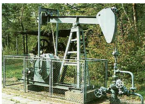
BÓBRKA - SKENSEN GÓRNICTWA NAFTOWEGO

Śniadanie. Przejazd Pętlą Bieszczadzka: Bóbrka (Skansen Przemysłu Naftowego), Lesko (Synagoga, cmentarz Żydowski), Rzepedź - cerkiew, Komańcza (miejsce uwięzienia Prymasa Tysiąclecia, Cerkiew), Baligród (Pomnik Karola Świerczewskiego), Solina - Jezioro Solińskie i zapora, rejs Statkiem po jeziorze. Obiadokolacja. Nocleg.