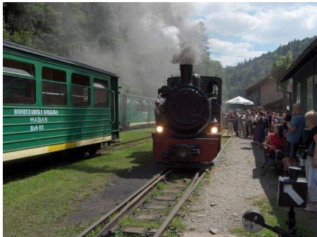
BIESZCZADZKA KOLEJKA LEŚNA