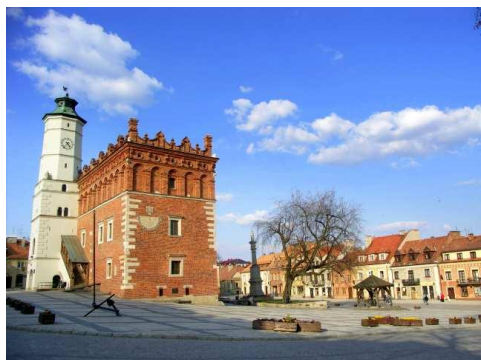
SANDOMIERZ - RYNEK

Godz. 4.00 - wyjazd. Po drodze zwiedzanie: Sandomierz (Wawóz Królowej Jadwigi, Kościół Dominikanów, Zamek, Katedra (wewnątrz), Dom długosza (Muzeum Diecezjalne, wewnątrz), Collegium Gostomianum, Rynek z ratuszem. Poznawanie miejsc, które są plenerem serialu „Ojciec Mateusz”). Łańcut - Zamek Lubomirskich. Przejazd do ośrodka w Solinie. Zakwaterowanie. Obiadokolacja. Nocleg