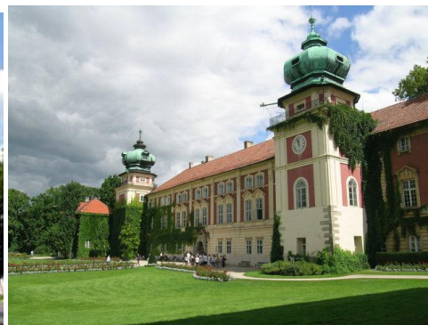
ŁAŃCUT - ZAMEK LUBOMIRSKICH