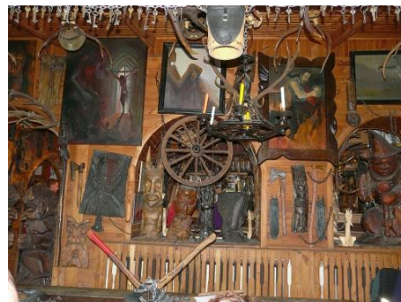
WNĘTRZE KNAJPY „SIEKIEREZADA”