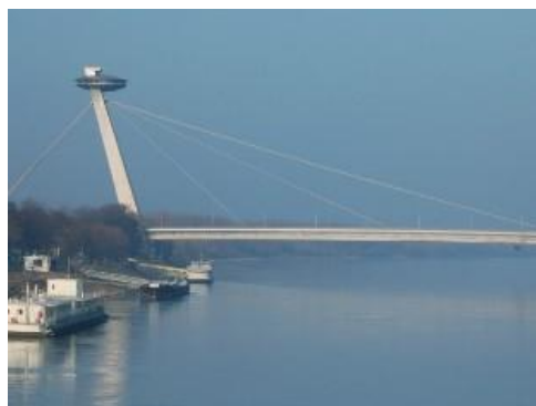
Bratysława - restauracja UFO na Nowym Moście