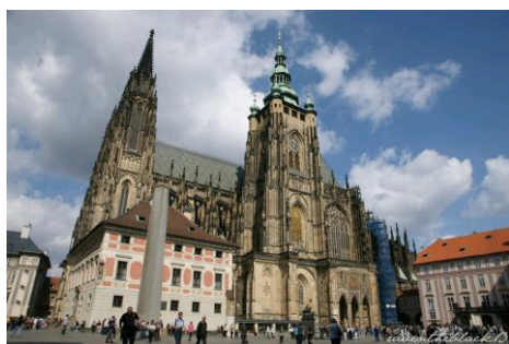
Praga - katedra św. Wita

Po śniadaniu wykwaterowanie z hotelu. Przejazd do Pragi. Zwiedzanie miasta z przewodnikiem: Klasztor na Strachowie, Hradczany, Pałac Prezydencki, Katedra św. Wita. Zamek Królewski, Most Karola, Rynek Starego Miasta. Obiad. Czas wolny. Wyjazd do Polski. Powrót do Sieradza w godzinach nocnych (ok. 2.00 - 3.00)