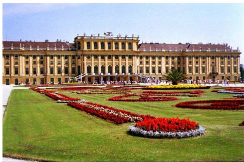
Wiedeń - Pałac Schonbrunn

Euro). Przejazd na Prater - wiedeński park rozrywki. Czas Wolny. Wieczorem uczestnictwo w rejsie po Dunaju z muzyką i kilkudaniową kolacją.