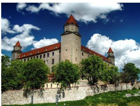
Bratysława - Zamek

Wyjazd z Sieradz w godzinach porannych (ok. 4.00). Przejazd przez Słowację . Zwiedzanie Bratysławy z przewodnikiem. Stare Miasto, kościół św. Marcina, Zamek, Wieża Michalska. Teatr. Czas wolny. Możliwość wjazdu do restauracji UFO na Nowym Moście (4 Euro/osobę). Przejazd do Wiednia. Obiadokolacja w centrum. Przejazd do hotelu. Zakwaterowanie.