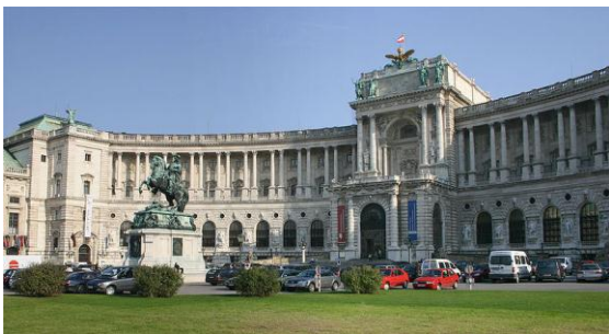
Wiedeń - Pałac Hofburg

Po śniadaniu przejazd na Wzgórze Kahlenberg , z którego w 1683 roku Król Polski Jan III Sobieski dowodził zwycięską bitwą z Turkami o Wiedeń . Następnie przejazd do centrum Wiednia . Zwiedzanie miasta z przewodnikiem: Ringstrasse, Plac Marii Teresy, Pałac Hofburg, ul. Graben - kolumna św. Trójcy, kościół św. Piotra, katedra św. Stefana, Parlament, Ratusz. Czas Wolny. Przejazd do Winiarni w dzielnicy winiarzy Grinzing. Obiadokolacja przy muzyce połączona z degustacją wina. Powrót do hotelu w godzinach wieczornych.