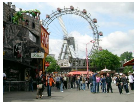
Wiedeń - Prater