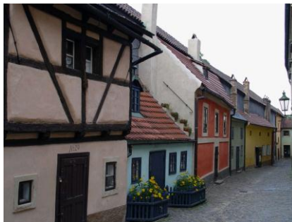
Praga - Złota Uliczka