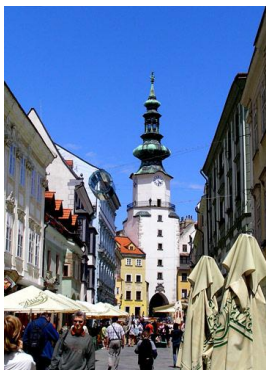
Bratysława - Wieża