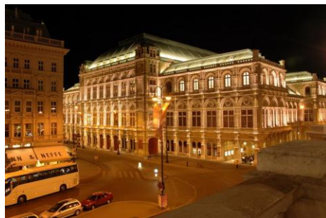
Wiedeń - Opera