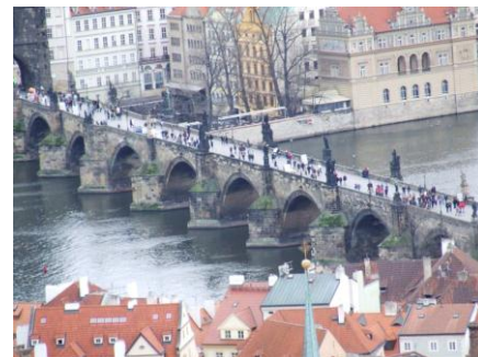
Praga - Most Karola

Program ma charakter informacyjny i może ulec niewielkim zmianom (m.in. kolejność zwiedzania). Cena uzależniona jest od ilości uczestników i terminu wycieczki.