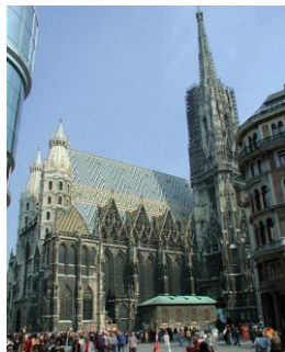
Wiedeń - Katedra św. Stefana