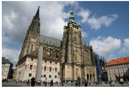
PRAGA - KATEDRA ŚW. WITA