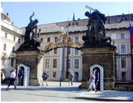
PRAGA - PAŁAC PREZYDENCKI