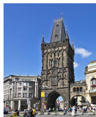
PRAGA - BRAMA PROCHOWA