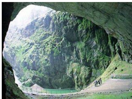
Jaskinia - Morawski Kras

4.00 - wyjazd z Sieradza. Przejazd do Czech. Zwiedzanie jaskini w Morawskim Krasie z przewodnikiem. Przejazd pociągiem elektrycznym między jaskiniami; zwiedzanie jaskini Punkevní z przejażdżką łódką po rzece podziemnej. Przejazd kabinką do przepaści Macocha (głębokość 138,7 m). Następnie przejazd na teren Lednicko Vitický - między czeskimi zamkami, wpisany na listę UNESCO, zwiedzanie neogotyckiego zamku Lednice z przepięknym parkiem i szklarnia z roślinami egzotycznymi. Po południu przejazd do historycznego Mikulova z barokowym zamkiem i wieloma zabytkami kościelnymi. Mikulov i okolica są również głównym regionem winnic. Kolacja w piwnicy winnej z degustacją wina i typową muzyką. Zakwaterowanie. Nocleg