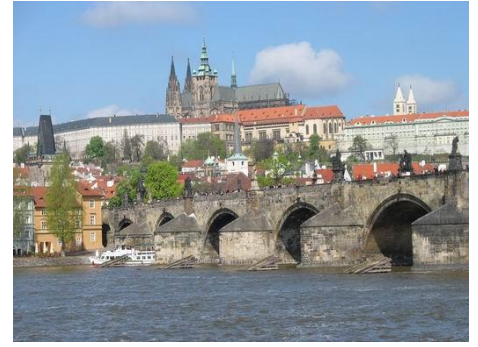
PRAGA - MOST KAROLA