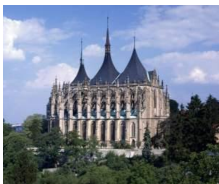
KUTNA HORA - KOŚCIÓŁ ŚW. BARBARY

Po śniadaniu przejazd do Kutnej Hory . Zwiedzanie średniowiecznego miasteczka wpisanego na Listę Światowego Dziedzictwa Kultury UNESCO, słynącego z historycznych kopalni srebra. Zwiedzanie: gotycki kościół św. Barbary, Stare Miasto z zabytkowymi kościołami, renesansową i barokową zabudową rynku, ossuarium - gotycka podziemna kostnica. Po południu przejazd do Pragi . Zwiedzanie: Stare Miasto: Kościół św. Mikołaja, Pomnik Jana Husa, Karolinum - pierwszy Uniwersytet w Europie Środkowej. Przejście Drogą Królewską przez Bramę Prochową. Obiad. Czas wolny. Wieczorem rejs statkiem po Wлтаwie. Zakwaterowanie w hotelu. Nocleg.