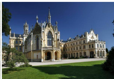
Morawy - Zamek Lednice