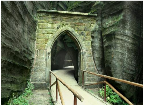
SKALNE MIASTO (CZECHY)

Po śniadaniu przejazd do Skalnego Miasta . Zwiedzanie rezerwatu przyrody SKALNE MIASTO - najciekawszej części Gór Stołowych. Oglądanie przeróżnych kilkudziesięciometrowych form skalnych o fantastycznych kształtach przedmiotów, ludzi i zwierząt. Płynąca tędy rzeka Metuja utworzyła głęboki wąwóz oraz wodospad (19 m). Czas Wolny. Następnie przejazd do Polski do Kłodzka . Zwiedzanie Twierdzy Kłodzkiej - jednych z największych i najciekawszych fortyfikacji w Europie. Obiad. Następnie wyjazd do Sieradza. Powrót w godzinach wieczornych.