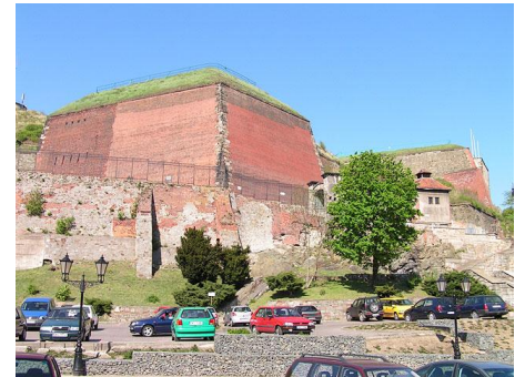
KŁODZKO - TWIERDZA

Program ma charakter informacyjny i może ulec niewielkim zmianom (m.in. kolejność zwiedzania).