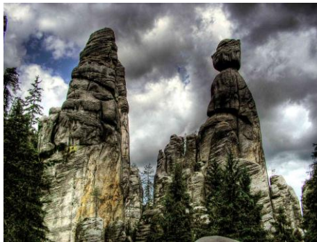
SKALNE MIASTO (CZECHY)