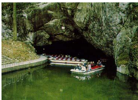
Morawski Kras - podziemny spływ łódkami