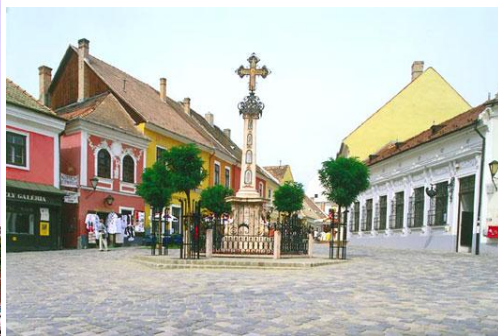
Szentendre - malownicze uliczki