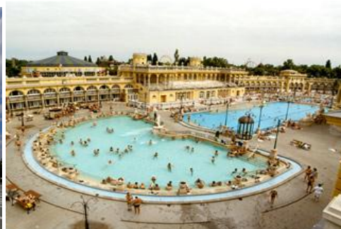
Budapeszt - baseny termalne w Parku Miejskim