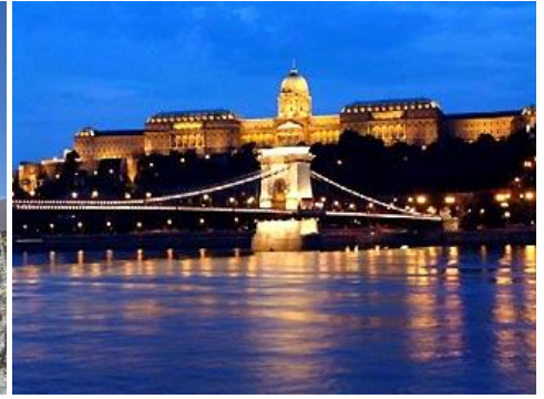
Budapeszt - Zamek i Most Łańcuchowy

Program ma charakter informacyjny i może ulec niewielkim zmianom (m.in. kolejność zwiedzania). Cena uzależniona jest od ilości uczestników i terminu wycieczki.