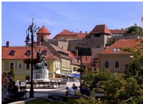
Eger - widok na zamek

Śniadanie. Wyjazd i zwiedzanie: : Eger (Bazylika, Liceum, Pałac Prałatów, kościół Minorytów, Minaret, Egri Var - zamek). Degustacja wina i gulaszu w winiarni w Dolinie Pięknej Pani . Przejazd do Góddollo i zwiedzanie największego pałacu na Węgrzech , letniej rezydencji królewskiej cesarzowej Sisi. Wieczorem kolacja z pokazem folklorystycznym w czardzie (typowej węgierskiej gospodzie) w Budapeszcie . Powrót do hotelu. Nocleg.