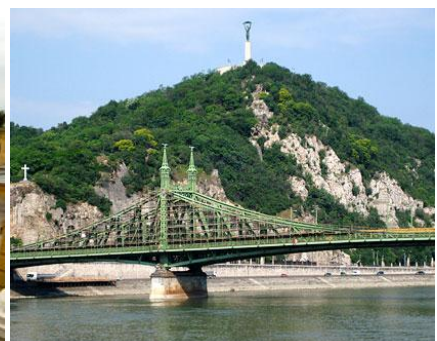
Budapeszt - Wzgórze Gellerta