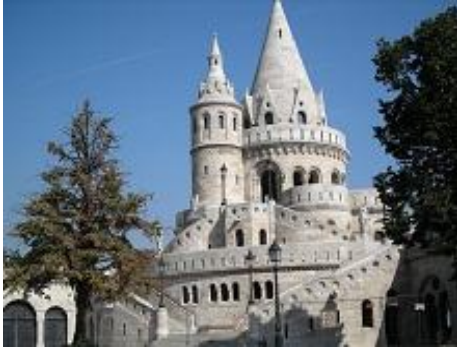
Budapeszt - Baszty Rybackie

Wyjazd do Polski. Po drodze obiad na Słowacji. Powrót około godz. 2.00