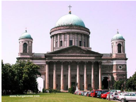
Esztergom - bazylika

3.00 - zbiórka i wyjazd z Polski. Przejazd przez Słowację do Esztergom - zwiedzanie największej węgierskiej bazyliki, jednego z największych kościołów w Europie (możliwość wejścia na taras widokowy, bilet ok. 500 Forintów). Następnie przejazd do miasta artystów Szentendre : Sobór Belgradzki, Kościół Św. Jana, Rynek oraz wizyta w Sklepie i Muzeum Marcepanu (muzeum dodatkowo płatne ok. 500 Forintów). Spacer uliczkami miasta. Przyjazd do hotelu w Budapeszcie . Zakwaterowanie, obiadokolacja, nocleg.