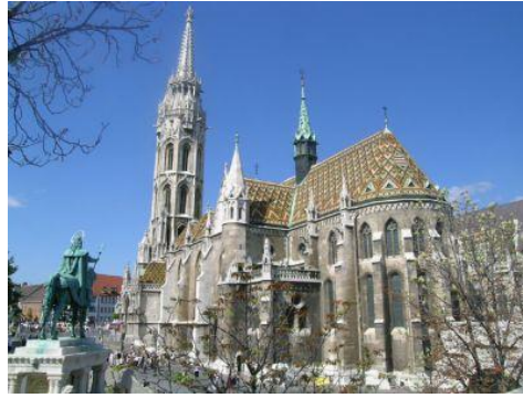
Budapeszt - Kościół Macieja