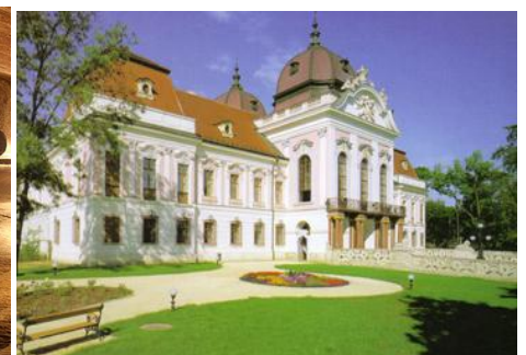
Godollo - pałac cesarzowej Sisi