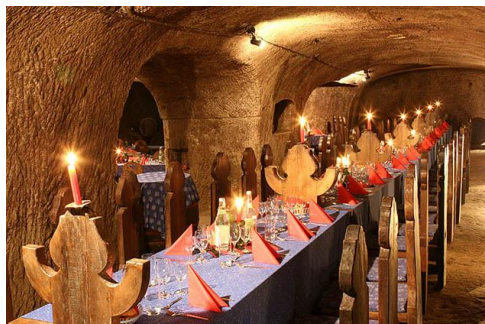
Eger - winiarnia w Dolinie Pięknej Pani