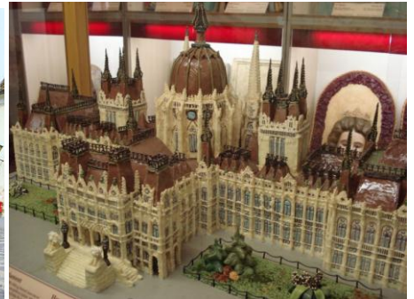
Szentendre - „marcepanowy parlament”