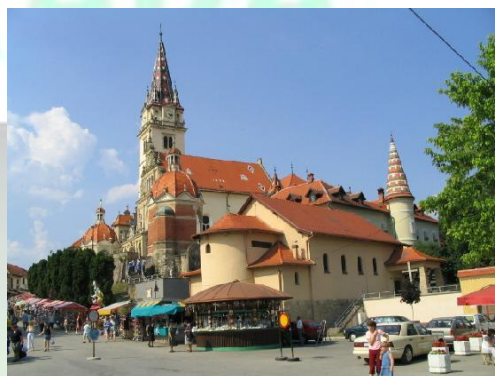
Marija Bistrica - narodowe sanktuarium Chorwacji