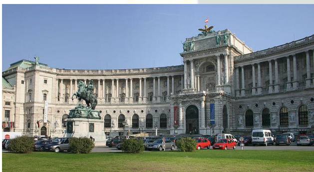
Wiedeń – Pałac Hofburg

Ok. 22.30 – przyjazd do miejsca zakwaterowania w MEDJUGORJE . Obiadokolacja. Nocleg