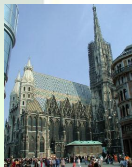
Wiedeń – Katedra św. Stefana