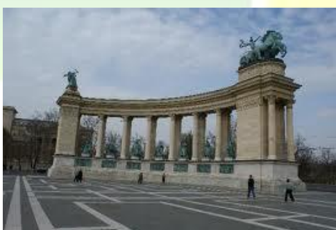
Budapeszt - plac bohaterów