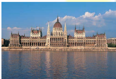
Budapeszt - parlament