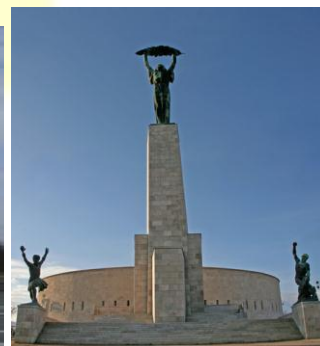
Budapeszt - Wzgórze Gellerta