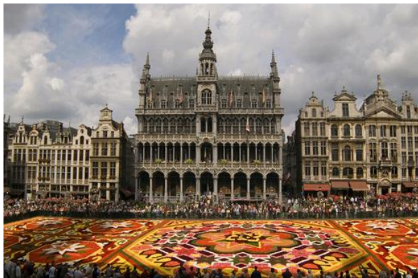
BRUKSELA - RYNEK GRAND PLACE Z RATUSZEM