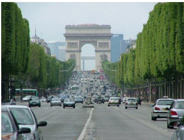
PARYŻ - ŁUK TRIUMFALNY (WIDOK Z PÓL ELIZEJSKICH)