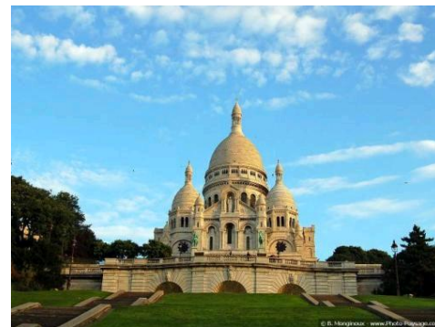
PARYŻ - BAZYLIKA SACRE COEUR