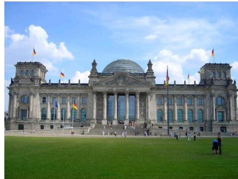
BERLIN - REICHSTAG