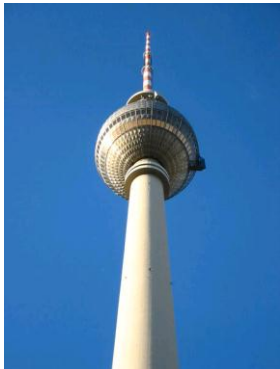
BERLIN - WIEŻA TELEWIZYJNA

4.00 - wyjazd. 11.00 - przyjazd do Berlina . Zwiedzanie miasta. Alexanderplatz z Wieżą Telewizyjną (11 Euro na osobę). Katedra Protestancka. Wyspa Muzeów. Katedra św. Jadwigi. Spacer Aleją Unter den Linden. Brama Brandenburska. Reichstag. Czas Wolny. 16.00 - wyjazd w kierunku Holandii. 23.00 - przyjazd do hotelu w okolicach Amsterdamu