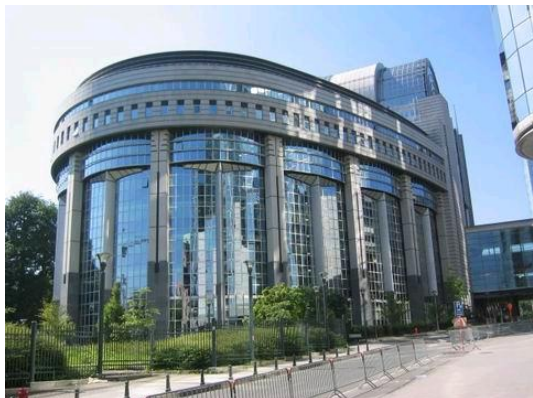
BRUKSELA - PARLAMENT EUROPEJSKI

8.00 - śniadanie. Przejazd do Brukseli . 9.00 - 15.00 - zwiedzanie miasta. Dzielnica Unii Europejskiej (Budynek Rady Europy, Komisji Europejskiej i Parlamentu Europejskiego), Pałac Królewski, Starówka: rynek Grand Place ze pięknym gotyckim ratuszem, Fontanna Maneken Pis - symbol miasta, sklepy ze słynną belgijską czekoladą, Czas Wolny. Przejazd metrem pod Atomium - budowlę w kształcie atomu żelaza, zbudowaną na Wystawę Światową w 1958 r. Stamtąd odjazd autokarem do Polski