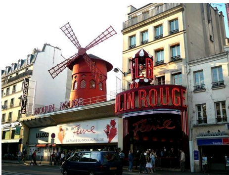
PARYŻ - MOULIN ROUGE