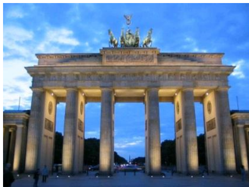
BERLIN - BRAMA BRANDENBURSKA