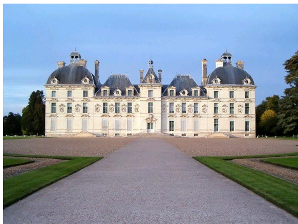
ZAMEK W CHEVERNY

7.00 - śniadanie. Wyjazd w kierunku Zamków nad Loarą . 10.00 - 15.00 - zwiedzanie zamku w Cheverny (wstęp płatny ok. 6 Euro - przy bilecie grupowym). Przejazd do zamku w Chambord . Zwiedzanie (wstęp płatny ok. 8 Euro - przy bilecie grupowym). Czas wolny. 15.00 - 22.00 - przejazd na nocleg do hotelu w okolicach Brukseli.