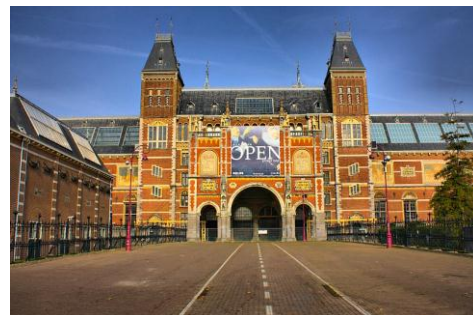
AMSTERDAM - MUZEUM NARODOWE