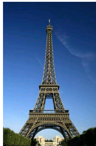
PARYŻ - WIEŻA EIFFEL'A