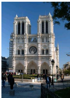
PARYŻ - KATEDRA NOTRE DAME

8.30 - śniadanie. Wyjazd do Paryża na zwiedzanie miasta. 10.00 - 20.00 - zwiedzania z przewodnikiem. Luwr (z zewnątrz), Ogrody Tuileries, Plac Concorde, Pola Elizejskie, Dzielnica La Defense, Łuk Triumfalny, Spacer po Monmartre: Plac Pigalle, Moulin Rouge, Bazylika Sacre Coeur. Czas Wolny. 22.00 - powrót do hotelu