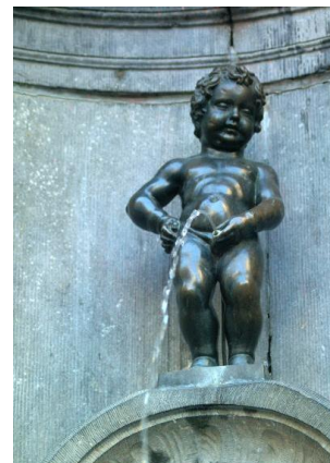
BRUKSELA MANNEKEN PIS