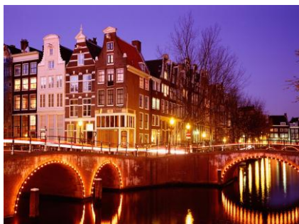
AMSTERDAM - ULICZKI NAD KANAŁAMI

8.00 - śniadanie. Wyjazd do Amsterdamu . 9.00 - 15.00 - zwiedzanie miasta. Starówka. Pałac Królewski. Dzielnica Muzeów. Spacer wzdłuż kanałów. Fakultatywnie możliwość godzinnego rejsu statkiem po kanałach (13 Euro) oraz wizyty w Muzeum Narodowym z dziełami Rembrandta (13 Euro). Czas Wolny. 15.00 - 22.00 - przejazd do hotelu pod Paryżem