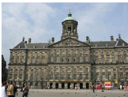
AMSTERDAM - PAŁAC KRÓLEWSKI