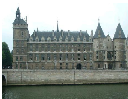
PARYŻ - PAŁAC SPRWIEDLIWOŚCI