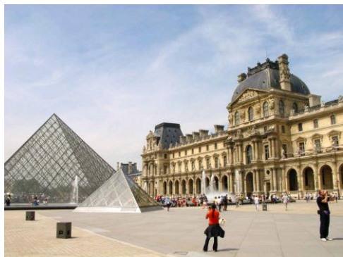
PARYŻ - LUWR