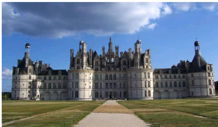
ZAMEK W CHAMBORD