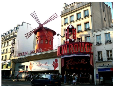
PARYŻ- MOULIN ROUGE