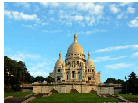
PARYŻ - BAZYLIKA SACRE COEUR