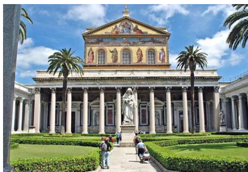
Rzym - Bazylika św. Pawła za murami

Śniadanie. Zwiedzanie: Bazylika Św. Pawła za Murami, Bazylika Santa Maria Maggiore, Colosseum, Forum Romanum, Capitol, Plac Wenecki. Czas wolny. Przejazd do hotelu. Obiadokolacja. Nocleg w okolicy Rzymu.