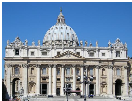
Rzym - Bazylika św. Piotra

Śniadanie. Wykwaterowanie z hotelu. Zwiedzanie Watykanu: Plac i Bazylika św. Piotra, katakumby z Grobem Jana Pawła II, Muzea Watykańskie z Kaplicą Sykstyńską, Bazylika Św. Jana na Luteranie. Obiad. Czas wolny. Wyjazd w stronę Polski w godzinach popołudniowych. Późnym wieczorem przyjazd do hotelu w okolicach Wenecji. Nocleg.