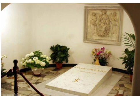
Rzym - Grób Jana Pawła II