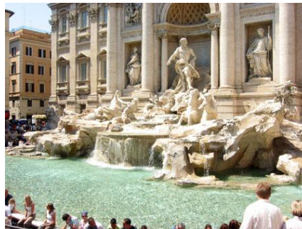
Rzym - Fontanna di Trevi