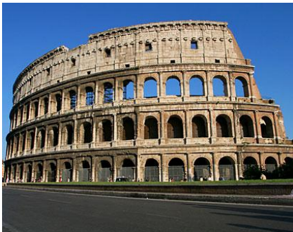
Rzym - Coloseum