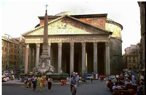
Rzym - Panteon

Śniadanie. Przejazd do Rzymu. Zwiedzanie Rzymu z wykorzystaniem metra: Panteon, Piazza Navona, Plac Hiszpański ze słynnymi schodami hiszpańskimi, Fontanna di Trevi. Czas wolny. Przejazd do hotelu. Obiadokolacja. Nocleg w okolicy Rzymu.