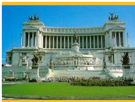
Rzym - Plac Wenecki