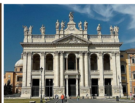
Rzym - Bazylik św. Jana na Lateranie