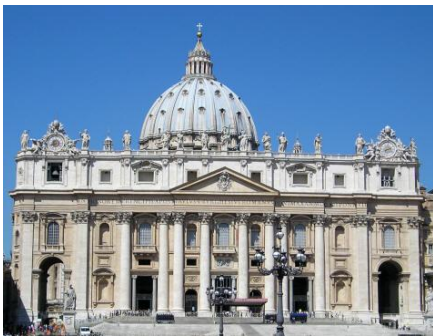
Rzym - Bazylika św. Piotra

Śniadanie, zwiedzanie Watykanu: Plac i Bazylika św. Piotra, Grób Jana Pawła II, Muzea Watykańskie z Kaplicą Sykstyńską. Czas wolny. Zwiedzanie Rzymu z wykorzystaniem metra: Bazylika Św. Pawła za Murami, Bazylika Św. Jana na Luteranie, Santa Maria Maggiore. Obiadokolacja, nocleg w okolicy Rzymu.