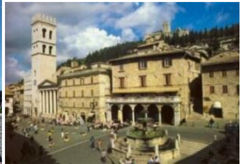
Asyż – Piazza Comune