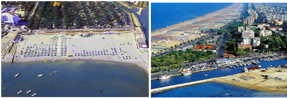
Rimini - plaże