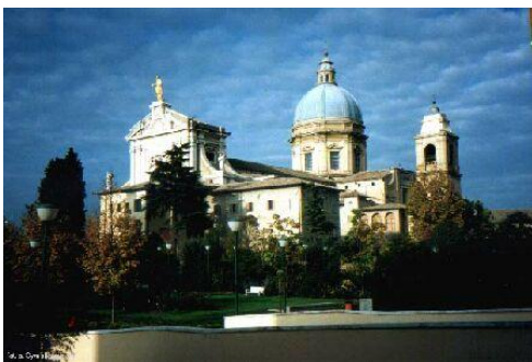
Asyż – Bazylika MB Anielskiej

Śniadanie. Przejazd do San Marino – czas wolny na zakupy. Następnie zwiedzanie Asyżu: Bazylika MB Anielskiej i Św. Franciszka, Piazza Comune. Przejazd w kierunku Rzymu. Zakwaterowanie w hotelu. obiadokolacja, nocleg.