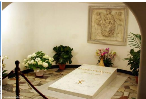
Rzym - Grób Jana Pawła II