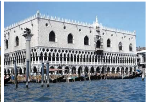
Wenecja – Pałac