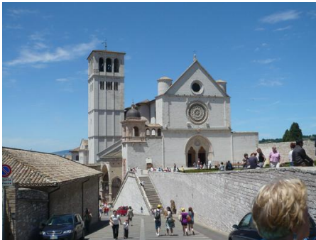
Asyż – Bazylika Św. Franciszka