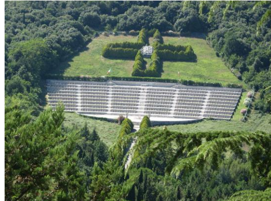
Monte Cassino - polski cmentarz wojskowy