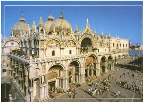
Wenecja – Bazylika św. Marka