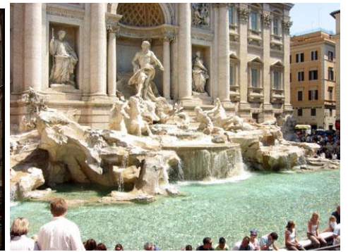
Rzym - Fontanna di Trevi