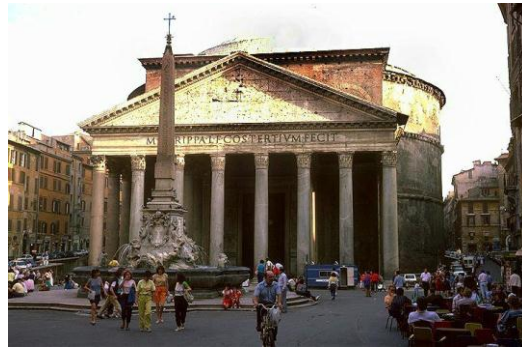
Rzym - Panteon