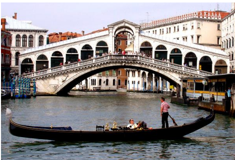
Wenecja – Ponte Rialto i Canale Grande

Przyjazd do Wenecji, zwiedzanie: przejazd tramwajem wodnym po Canale Grande do Placu Św. Marka, Bazylika Św. Marka, Pałac Dożów, Wieża Zegarowa, Most Westchnień, spacer w kierunku Ponte Rialto. Czas wolny. Przejazd na nocleg w okolicach Rimini. Obiadokolacja, nocleg.